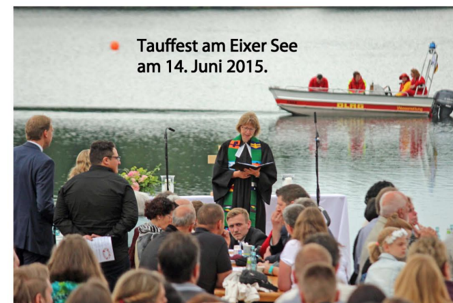
Tauffest am Eixer See am 14. Juni 2015.